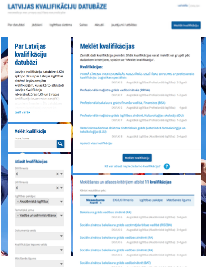
Datubāzes mājaslapas attēls

Terminu skaidrojošā vārdnīca Ikvienam pieejami skaidrojumi biežāk lietotajiem jēdzieniem.