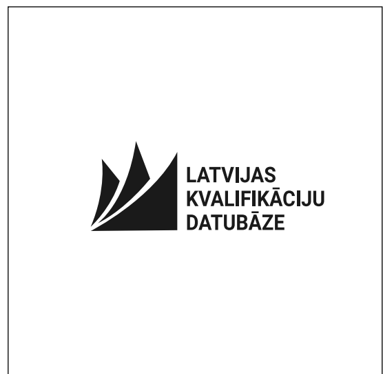
Melnas krāsas izpildījumā