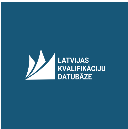
Balts uz tumša fona